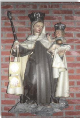
Statua della Vergine del Carmelo di Salamanca, ora nel Carmelo di Bruxelles.

Molti monasteri fondati da Anna di Gesù sussistono ancora, ma è in quello di Bruxelles, dove riposa il suo corpo nella chiesa delle carmelitane, che la sua memoria rimane più viva. Oltre alle lettere e a vari oggetti, le suore di Bruxelles hanno anche la grazia di possedere il mantello che Santa Teresa donò alla sua amata figlia durante il loro ultimo incontro: "Scambiamoci i mantelli, figlia mia, prendi il mio, che è nuovo e più conveniente per te che sei giovane, e dammi il tuo, Dato che è vecchio e usurato, mi starà molto bene.